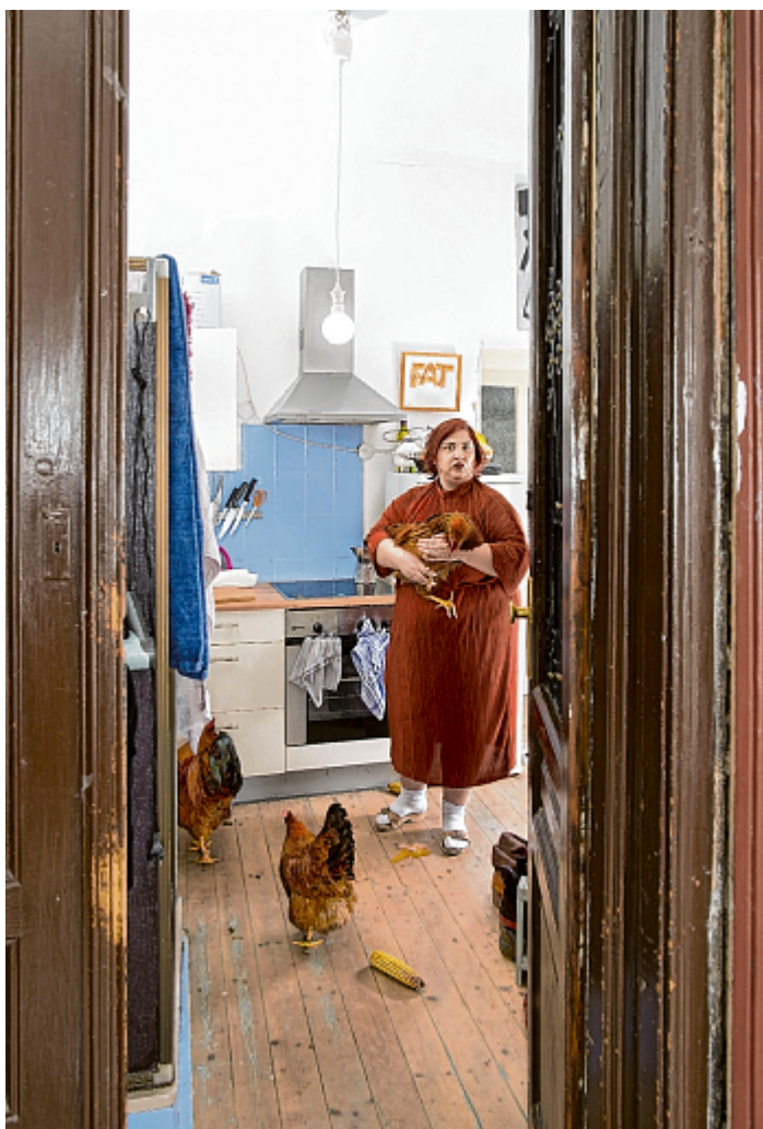
Privat-Performance samt gemieteten Hühnern für die Wiener Fotografin Kati Bruder, deren liebstes Motiv Menschen sind.

Fotoforum. Adolf-Pichler-Platz 8, Innsbruck; bis 3. April, Di-Fr 15–19 Uhr, Sa 10–13 Uhr