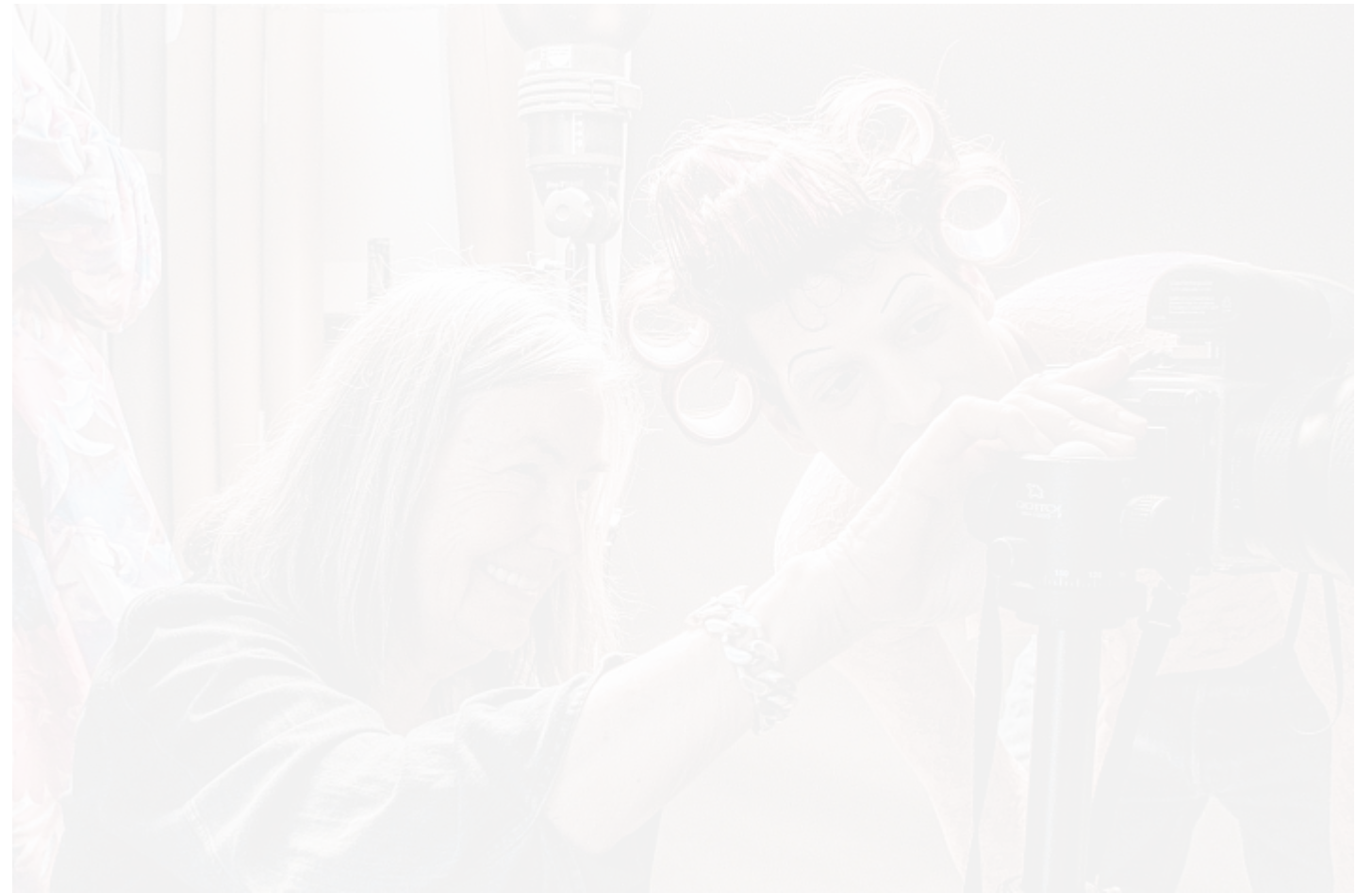
„Großartig, ganz großartig“: Elfie Semotan arbeitet mit ihren Modellen auf Augenhöhe. Genügt ein Bild ihren Ansprüchen, ist die Freude groß.